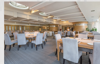
▶ ホテル/結婚式場(宴会場)