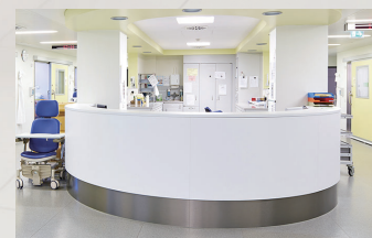
▶ ナースステーション