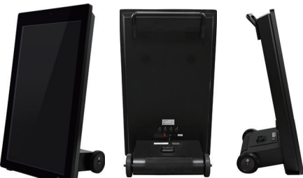
オープンプライス