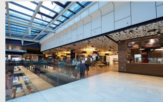
▶ 複合商業施設(レストラン街)

メニュー／価格案内 オススメ料理案内 季節限定商品案内 店内の雰囲気 ブランディング インバウンド対策