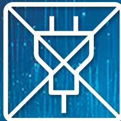
コードレス充電式