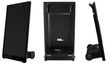
オープンプライス