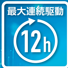
大容量バッテリー