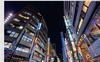
▶ 空中店舗(階上・地下店舗)