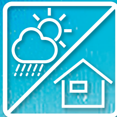
屋外用／屋内用 2タイプ