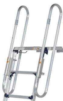
手すりを裏表 どちらでも設置可能