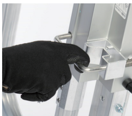
手すりロックは 指1本で操作可能